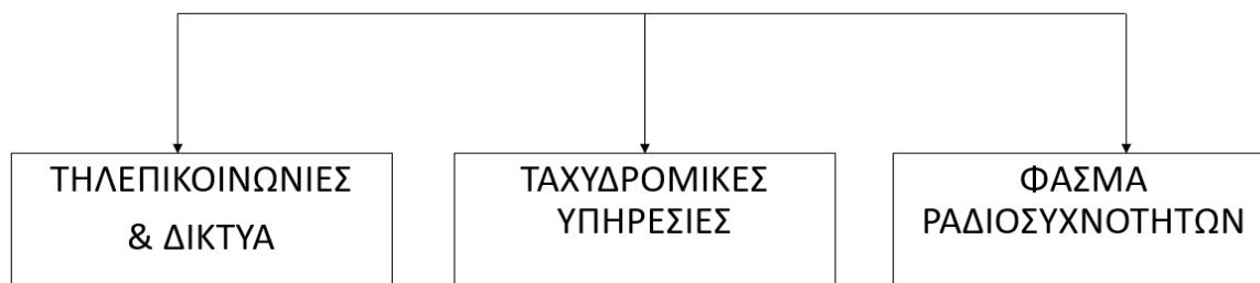
Εικόνα 1: Καταγγελίες σε ΕΕΤΤ ανά τομέα