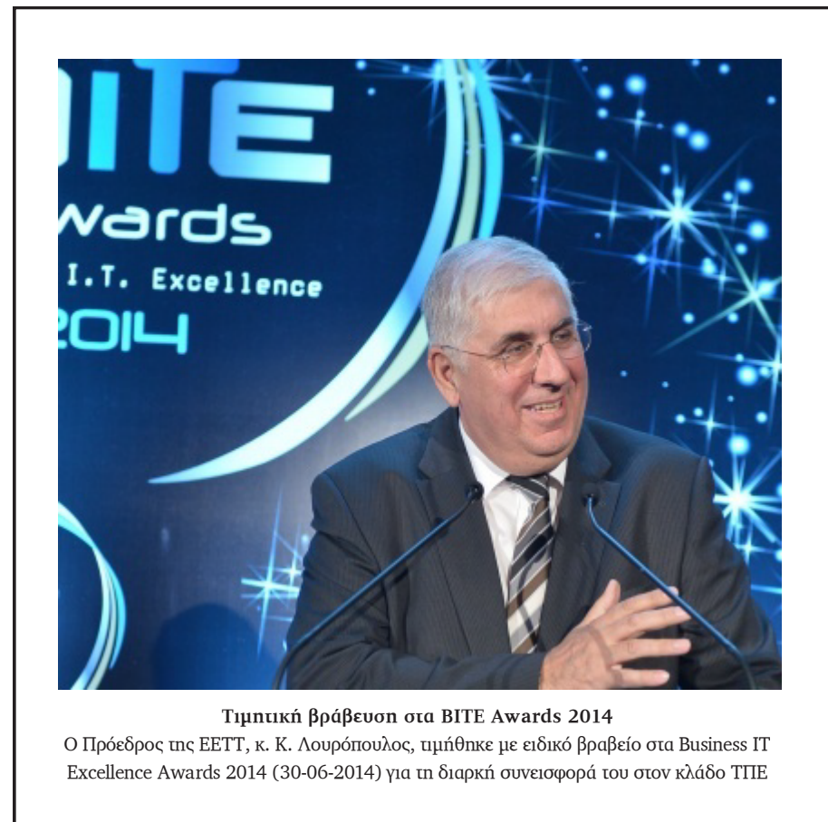
Τιμητική βράβευση στα BITE Awards 2014

Ο Πρόεδρος της ΕΕΤΤ, κ. Κ. Λουρόπουλος, τιμήθηκε με ειδικό βραβείο στα Business IT Excellence Awards 2014 (30-06-2014) για τη διαρκή συνεισφορά του στον κλάδο ΤΠΕ