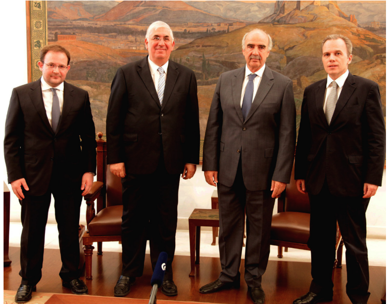
Παράδοση της Έκθεσης Πεπραγμένων 2013 στον Πρόεδρο της Βουλής, κ. Ε. Μείμαρακ Από αριστερά προς δεξιά: Δρ. Ν. Παπαουλάκης, Αντιπρόεδρος ΕΕΤΤ για τις ηλεκτρονικές επικοινωνίες, κ. Κ. Λουρόπουλος, Πρόεδρος ΕΕΤΤ, κ. Ε. Μείμαρακς, Πρόεδρος Βουλής, Δρ. Κ. Δελικωστόπουλος, Αντιπρόεδρος ΕΕΤΤ για τις ταχυδρομικές υπηρεσίες

Στον Τομέα Ηλεκτρονικών Επικοινωνιών, ενισχύθηκε η ανάπτυξη των Δικτύων Πρόσβασης Νέας Γενιάς, διασφαλίζοντας την ποιότητα της υπηρεσίας για τους καταναλωτές και εξασφαλίζοντας στους εναλλακτικούς παρόχους τη δυνατότητα να διαθέσουν στην αγορά προϊόντα VDSL ισότιμα και υπό ανταγωνιστικές συνθήκες με τον ΟΤΕ. Επίσης, η ΕΕΤΤ προχώρησε στη μείωση των τελών στη χονδρική αγορά τερματισμού κλήσεων προς όλα τα κινητά δίκτυα και τη μείωση στα ανώτατα όρια χονδρικών και λιανικών τιμών υπηρεσιών περιαγωγής, ολοκλήρωσε τον έλεγχο συμμόρφωσης του ΟΤΕ, εξέδωσε νέο Κανονισμό για τη διαχείριση και εκχώρηση Ονομάτων Χώρου (Domain Names), ενώ ολοκλήρωσε την ανάλυση των αγορών φωνητικών κλήσεων και