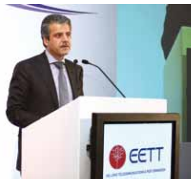
κ. Μενέλαος Δασκαλάκης, Γενικός Γραμματέας Τηλεπικοινωνιών & Ταχυδρομείων, ΥΠΑΝΥΠ