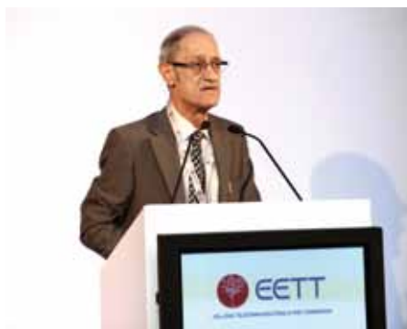
Δρ. Πόλυς Μιχαηλίδης, Επίτροπος Ρυθμίσεως Ηλεκτρονικών Επικοινωνιών & Ταχυδρομείων Κύπρου