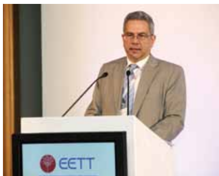
Δρ. Λεωνίδας Κανέλλος, Πρόεδρος EETT & BEREC

Παρουσιάσεις και σχετικό υλικό είναι διαθέσιμα στο www.eett.gr .