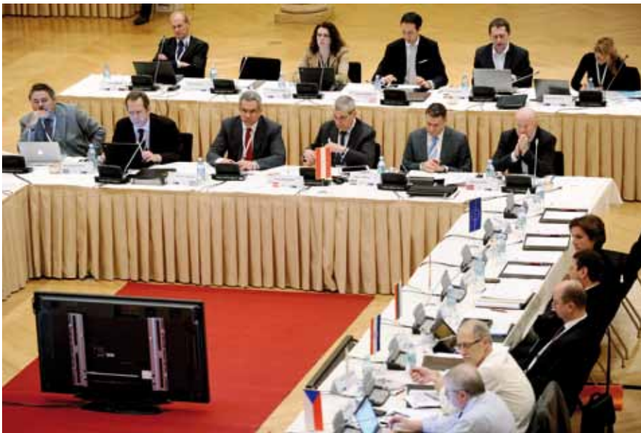
Το Προεδρείο του BEREC κατά τη συνεδρίαση της Ολομέλειας του Σώματος στη Λιουμπλιάνα.