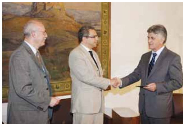
Από αριστερά: Οι κ.κ. Μ. Σακκάς-Αντιπρόεδρος ΕΕΤΤ και Λ. Κανέλλος-Πρόεδρος ΕΕΤΤ με τον κ. Φ. Πετσάλνικο-Πρόεδρο της Βουλής.

Η Έκθεση είναι διαθέσιμη στο δικτυακό τόπο της ΕΕΤΤ ( www.eett.gr , Έντυπα/Εκθέσεις Πεπραγμένων/Πεπραγμένα 2009).