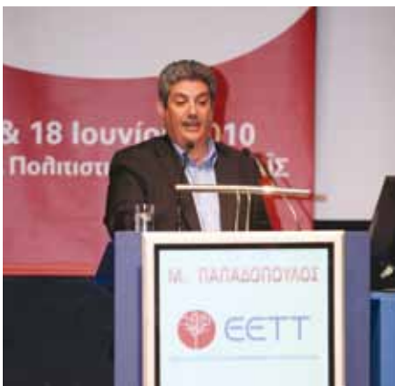
κ. Μάκης Παπαδόπουλος, Μέλος Κεντρικής Επιτροπής ΚΚΕ, Υπ. Τμήματος Οικονομίας.

Τη δεύτερη ημέρα του Συνεδρίου, ο Υφυπουργός Υποδομών, Μεταφορών, και Δικτύων, κ. Νίκος Σηφουνάκης, στο μήνυμά του προς τους συνέδρους, σημείωσε πως σήμερα στην Ελλάδα επιχειρείται ένα τεχνολογικό άλμα. Παρόλο που τα ποσοστά ψηφιακών χρηστών είναι ακόμη χαμηλά, έχει δοθεί προτεραιότητα στην ανάπτυξη δικτύων οπτικών ινών και την αξιοποίηση του ψηφιακού μερίσματος, με αναζήτηση δυνατοτήτων συνεργασίας ανάμεσα στον ιδιωτικό και το δημόσιο τομέα. Αναφερόμενος στην EETT, ο κ. Ση-