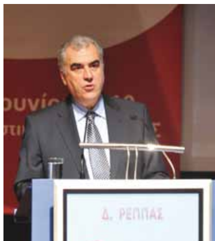
Ο Υπουργός Υποδομών Μεταφορών και Δικτύων, κ. Δ. Ρέππας.