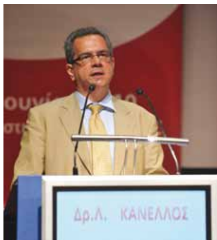
Ο Πρόεδρος της ΕΕΤΤ, Δρ. Λ. Κανέλλος.

τόνισε ότι η διάδοση των ευρυζωνικών δικτύων συνδέεται άρρηκτα με την οικονομική ανάπτυξη κάθε χώρας και τη δημιουργία νέων θέσεων εργασίας, και αναφέρθηκε στη σημαντική πρόοδο που έχει σημειωθεί τα τελευταία χρόνια στην Ελλάδα. Πιο συγκεκριμένα, επεσήμανε πως η ευρυζωνική διείσδυση έχει ξεπεράσει το ποσοστό του 18%, οι ονομαστικές ταχύτητες πρόσβασης στο Διαδίκτυο αυξήθηκαν θεαματικά, ενώ οι λιανικές τιμές μειώθηκαν ραγδαία, με αποτέλεσμα η χώρα μας να συγκαταλέγεται ανάμεσα στις οικονομικότερες του Οργανισμού Οικονομικής Συνεργασίας και Ανάπτυξης (ΟΟΣΑ) σε ό,τι αφορά το κόστος ευρυζωνικής πρόσβασης. Ειδική μνεία έγινε στις ρυθμιστικές παρεμβάσεις που απαιτούνται αλλά και στο σημαίνοντα ρόλο της ΕΕΤΤ στη διαμόρφωση του πλαισίου και την εμπέδωση