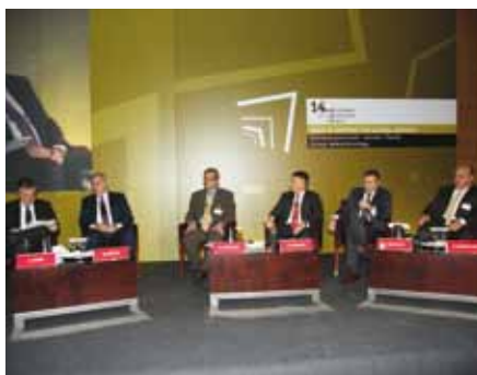
Στιγμιότυπο από το «14 th Roundtable with the Government of Greece» του Economist.

Τον Απρίλιο του 2010 πραγματοποιήθηκε στην Αθήνα η 14 η Συζήτηση Στρογγυλής Τραπέζης του Economist, με κύριο θέμα τη στρατηγική ηγεσίας για την κυβέρνηση, τις επιχειρήσεις και την οικονομία.