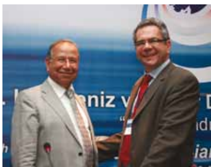
Ο Πρόεδρος της EETT, Δρ. Λ. Κανέλλος (δεξιά) με τον Πρόεδρο της ICTA, Δρ. T. Acarer στην 5 η Συνδιάσκεψη Κασπίας και Μαύρης Θάλασσας.

Κατόπιν πρόσκλησης της Τουρκικής Ρυθμιστικής Αρχής (ICTA), ο Δρ. Λ. Κανέλλος συμμετείχε στην 5 η Συνδιάσκεψη Κασπίας και Μαύρης Θάλασσας που έγινε στην Κωνσταντινούπολη τον Απρίλιο του 2010, με θέμα «Το Μέλλον των Ευρωζωνικών Δικτύων», προεδρεύοντας στην πρώτη ενότητα «Ρυθμιστικές Στρατηγικές για την Ευρωζωνική Ανάπτυξη». Με παρέμβασή του αναφέρθηκε στη σημασία της σύγκλισης κινητών και σταθερών δικτύων για την ανάπτυξη του ανταγωνισμού και στο ρόλο της αποδεδιομοποίησης του Τοπικού Βρόχου στην ευρωζωνική διείσδυση.