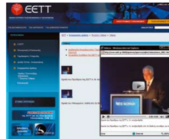
Εικόνα 3: Πολυμεσικές υπηρεσίες (video)

Αυτόματη ενημέρωση, δίνεται, για τις τελευταίες ειδήσεις που αφορούν την ΕΕΤΤ (Δελτία τύπου και Ανακοινώσεις).