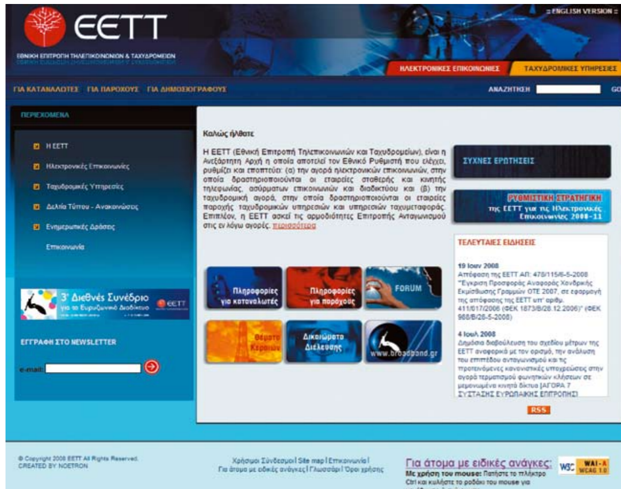
Εικόνα 1: Ο Νέος Δικτυακός Τόπος της ΕΕΤΤ

Η ενότητα που αφορά στους καταναλωτές, έχει εμπλουτιστεί με νέες πληροφορίες όπως: η διαδικασία υποβολής αιτημάτων/καταγγελιών προς την ΕΕΤΤ, τα βήματα που πρέπει να ακολουθούν οι καταναλωτές για την επίλυση τυχόν προβλημάτων που αντιμετωπίζουν, τα θέματα καταναλωτών για τα οποία είναι αρμόδια η ΕΕΤΤ, τα θέματα μη αρμοδιότητας της ΕΕΤΤ κ.λπ.