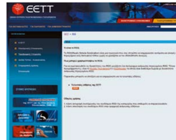
Εικόνα 2: Ενημέρωση μέσω RSS

Το RSS (Really Simple Syndication) είναι μια τεχνολογία που επιτρέπει στο χρήστη, να ενημερώνεται αυτόματα για αλλαγές στο περιεχόμενο ενός δικτυακού τόπου χωρίς να χρειάζεται να τον επισκέπτεται συνεχώς. Η δυνατότητα αυτή προϋποθέτει την εγκατάσταση ενός προγράμματος (RSS reader), το οποίο συλλέγει πληροφορίες από διαδικτυακούς τόπους που έχουν την ένδειξη RSS. Σχετικές πληροφορίες εγκατάστασης υπάρχουν στο Site της ΕΕΤΤ.