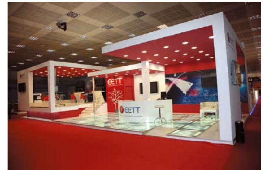
Πανοραμική Άποψη του Περιπέτρου της EETT

δώσει η Ρυθμιστική Αρχή καθώς και να παραλάβουν τον Οδηγό του ενημερωμένου καταναλωτή για τις υπηρεσίες Ηλεκτρονικών Επικοινωνιών.