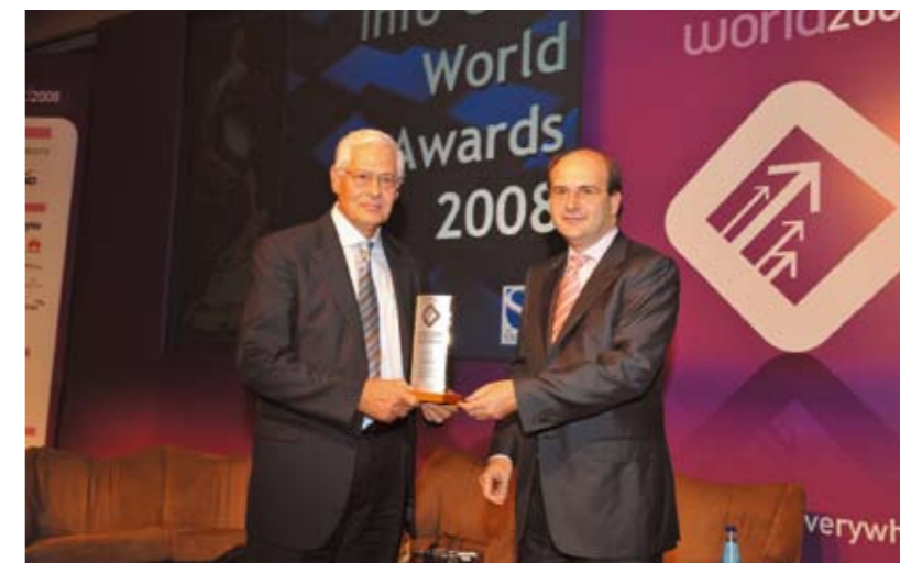
Ο Πρόεδρος της EETT Καθηγητής Νικήτας Αλεξανδρίδης παραλαμβάνει το βραβείο από τον Υπουργό Μεταφορών και Επικοινωνιών κ. Κωστή Χατζηδάκη

1) Ευρυζωνική κάλυψη , δίνοντας πλέον μεγαλύτερη σπουδαιότητα στην κάλυψη της Περιφέρειας