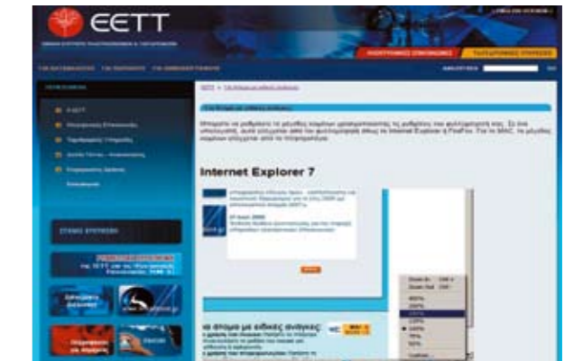
Εικόνα 4: Ευκολίες για Άτομα με Αναπηρίες

Η Διεθνής Κοινοπραξία World Wide Web Consortium (W3C), δημιουργήθηκε τον Οκτώβριο του 1994 με σκοπό να οδηγήσει το Web σε πλήρη αξιοποίηση των δυνατοτήτων του, μέσω της ανάπτυξης κοινών πρωτοκόλλων που θα προωθούν την εξέλιξη και θα διασφαλίζουν τη διαλειτουργικότητά του.