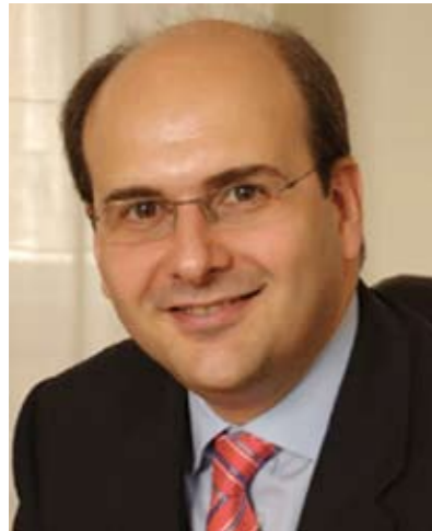
κ. Κωστής Χατζηδάκης Υπουργός Μεταφορών και Επικοινωνιών

Διάβασε τις πιο πρόσφατες μετρήσεις του Ευρωβαρόμετρου σχετικά με τη χρήση του διαδικτύου από τους πολίτες της Ε.Ε. Η χώρα μας είναι πρώτη στην Ευρώπη των 27, με ποσοστό πολιτών 58%, που δηλώνουν ότι κανένας στην οικογένειά τους δεν ενδιαφέρεται για το internet. Είναι επίσης πρώτη, μαζί με την Πορτογαλία, με ποσοστό πολιτών 16%, που απαντούν ότι δεν γνωρίζουν τι είναι το internet.