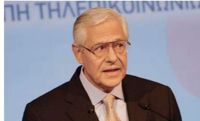
Ο Πρόεδρος της EETT Καθηγητής κ. Νικόλαος Αλεξανδρίδης

μισε «Όλοι καταλαβαίνουμε τις «παιδικές ασθένειες» μιας ραγδαία αναπτυσσόμενης ευρυζωνικής αγοράς. Ως Εθνικός όμως Ρυθμιστής, που προσπαθεί να καταστήσει τον ανταγωνισμό στις τηλεπικοινωνίες αποτελεσματικό προς όφελος του καταναλωτή, είμαστε υποχρεωμένοι να παρέμβουμε έγκαιρα και δυναμικά για να εξαλειφθούν οι αρρυθμίες που εμφανίζονται στην αγορά. Για να διευκολύνουμε δε αυτή τη διαδικασία, θέτουμε στο τραπέζι τον δικό μας δεκάλογο προτάσεων. Οι προτάσεις που η EETT βάζει στο τραπέζι για συζήτηση περιλαμβάνουν: 1) Σύσταση ομάδας εργασίας με σκοπό την οριοθέτηση αρμοδιοτήτων μεταξύ των