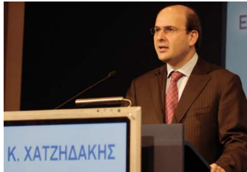
Ο Υπουργός Μεταφορών και Επικοινωνιών κ. Κωστής Χατζηδάκης

Ο Υπουργός Μεταφορών και Επικοινωνιών κ. Κ. Χατζηδάκης, τόνισε στην ομιλία του: «Πρέπει να είμαστε αρκετά ικανοποιημένοι από την πορεία της χώρας μας στον τομέα των τηλεπικοινωνιών. Αν και ξεκινήσαμε αργά σε σχέση με τους υπόλοιπους λαούς της Ευρώπης, κάναμε σημαντικά βήματα το τελευταίο διάστημα στη χώρα μας.