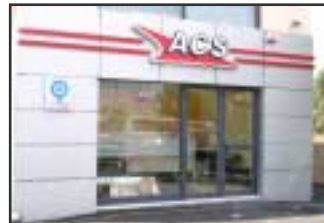
ACS pop: Σημείο Παρουσίας