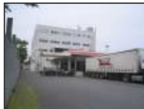
ACS Hubs : Κέντρα Διαλογής